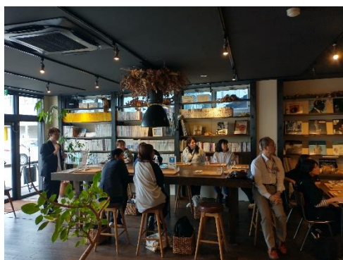
セカンドキッチン (昼食)