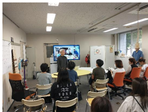
富山大学サステナビリティ国際研究センター