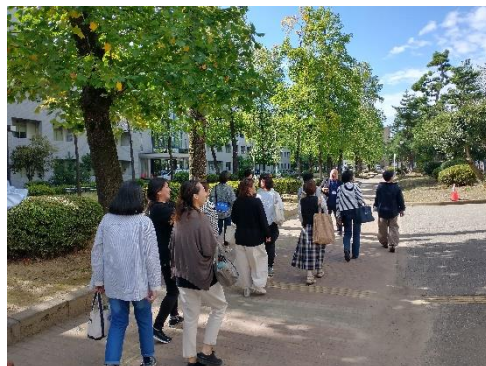
富山大学キャンパスツアー