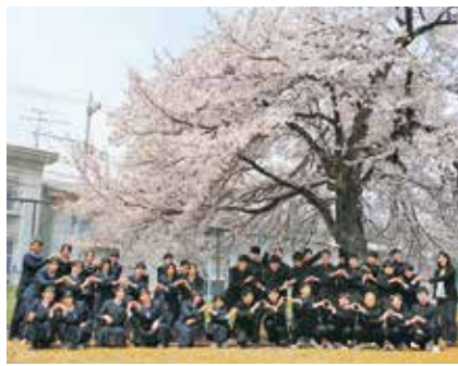
新入生オリエンテーションにて

今後は自分が進む道や目標を決定しなければなりません。将来の目標を模索している人は多いと思いますが、悩んだ時には先生方、家族、友人に相談したり、情報収集をしたりして、一つ二つ丁寧に目標に向かって進んで行ってください。八尾高校生皆様のご活躍を楽しみにしております。