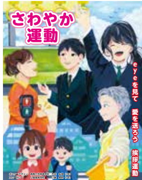
「さわやか運動」ポスター