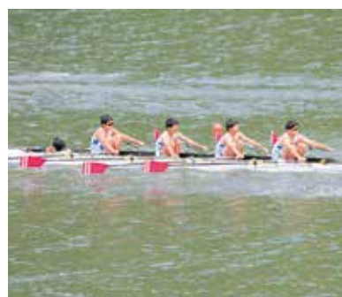
北信越高等学校ボート選手権大会

息子がボート部に入部し一年が経ちました。先日、北信越大会が富山で開催され、その大会に息子が選手として参加することもあつて、初めて大会を見に行きました。その時、遠目に息子へ声援を送り、レース後出迎えているボート部の仲間の姿を見たとき、これからも息子が仲間達と良好な関係を維持し続けてくれればと思えました。学生時代に苦楽を共にした仲間は人生でかけがえのない宝物だと思います。私も学生時代に同じ部活で苦楽を共にした仲間と今でも交流がありますが、彼ら