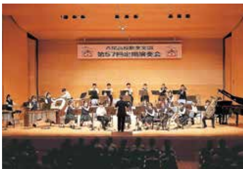
吹奏楽部定期演奏会

五月四日、婦中ふれあい館にて第57回定期演奏会が開催されました。第50回から毎年拝見させていただいていますが、年々質も高くなり、部員の気合いが観客にも伝わってきて、感動と至福の時間を過ごさせていただきました。多くの初心者だった娘を、ともに努力し協力することによって成長させていただいた仲間の皆さんには感謝の言葉しかありません。当日はコンク