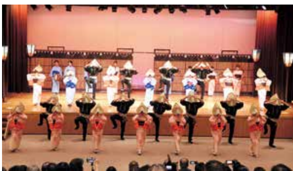
郷土芸能部演技発表会