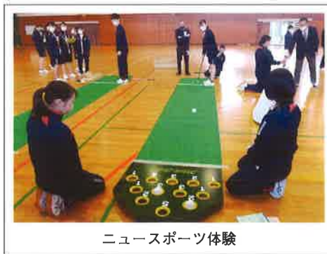
ニュースポーツ体験