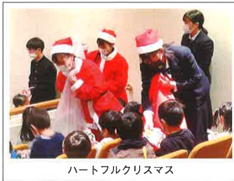
ハートフルクリスマス

誰もが分け隔てなく、安心して、個性を發揮し、ともに暮らしていくことのできる社会。その社会の実現に向けて、相手に寄り添う福祉マインドを持ち、広い視野で活動する実践力を持った人材、将来、地域や社会に貢献できる人材の育成を目指しています。