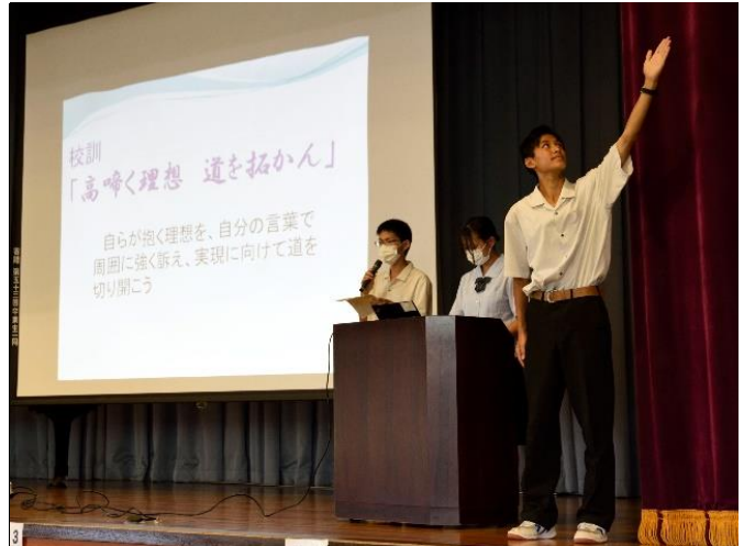
学校紹介(生徒会が担当)