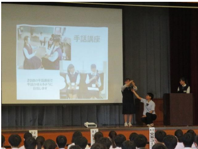
福祉コース紹介(コース生が担当)