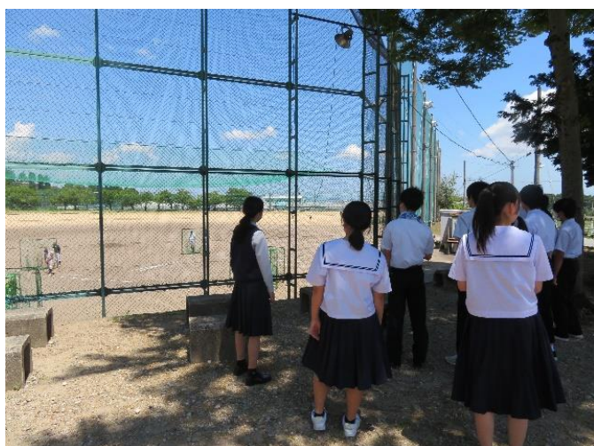
施設・部活動見学(グラウンド)