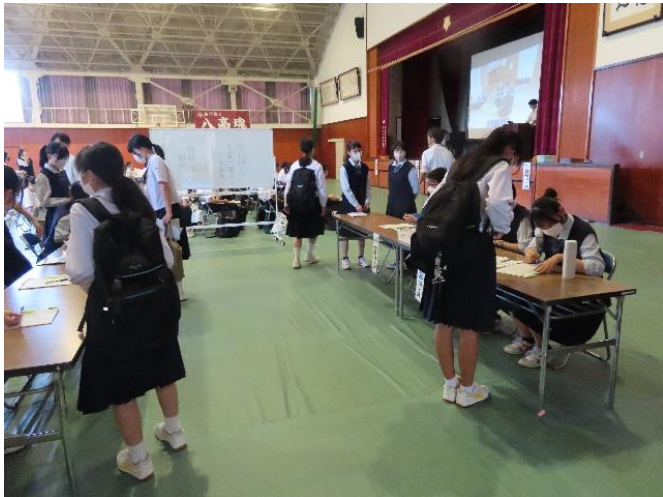
受付(八高生が担当)