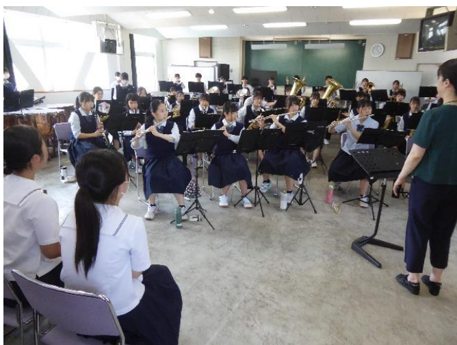
施設・部活動見学(吹奏楽)