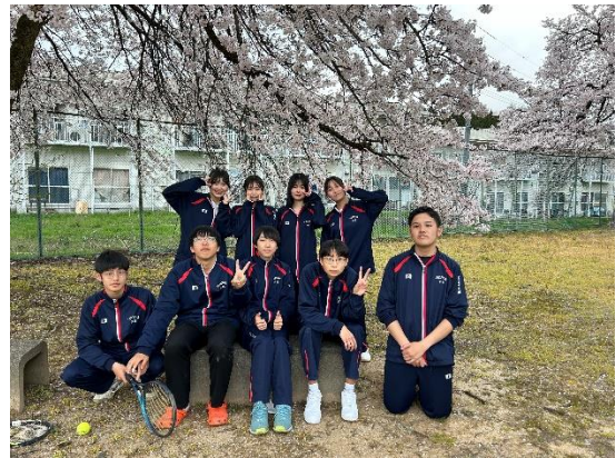
テニスコート横の桜の下で↑