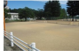
(パインパーク・本校テニスコート)