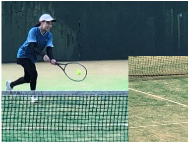
↑ 試合風景 →